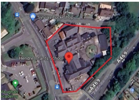
Y safle presennol