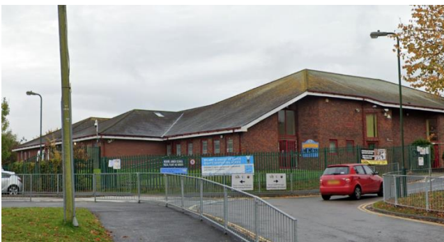
Ysgol Iau Hendre

Ar hyn o bryd, mae Ysgol Iau Hendre (Cyfnod Allweddol 2 : 7-11 oed) ac Ysgol Fabanod Hendre (Cyfnod Sylfaen a Chyfnod Allweddol 1 : 3-7 oed) yn gweithredu dros ddau safle ar wahân ar ddwy ochr St Cenydd Road, Caerffili.