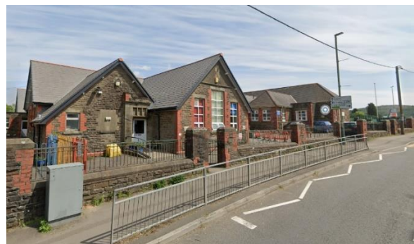
Ysgol Fabanod Hendre

Mae'n rhaid i bob ysgol ddarparu cwricwlwm sydd â chynnwys eang a chytbwys ac sy'n berthnasol i anghenion pob dysgwr. Dylai taith ddysgu'r plentyn fod yn ddi-dor drwy gydol ei amser yn yr ysgol, gan adeiladu ar brofiadau, sgiliau, gwybodaeth a dealltwriaeth wrth iddo wneud cynnydd.