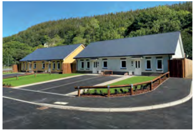
Llwybr Glan yr Afon, Deri

Rydym eisiau edrych i weld sut y gallwn fesur iechyd ein cymdogaethau