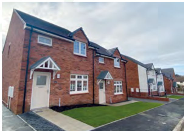
Tai fforddiadwy ym Mryngolwg, Croespenmaen (Pobl)

Mae Coridor Cysylltiadau'r Gogledd wedi llwyddo i ddenu buddsoddiad cyhoeddus a phreifat sylweddol, gan drawsnewid y rhan hon o'r Fwrdeistref Sirol a denu datblygiadau tai a swyddi newydd. Mae hyn wedi arwain at fwy o amrywiaeth yn y stoc tai yn nhermau'r math o gartrefi sydd ar gael ond mae angen nodi mwy o dir er mwyn adeiladu rhagor o dai. Mae diffyg cyflenwad o gartrefi newydd yn ogystal â phoblogrwydd yr ardal yn golygu bod prisiau wedi'u gwthio'n uwch ac nid yw llawer o bobl yn gallu fforddio i brynu neu rentu cartrefi. Mae'n bosibl y bydd y sefyllfa hon yn gwaethygu ymhellach oherwydd bod y Brif Dref, Ystrad Mynach, yn ganolfan gyflogaeth sylweddol ac mae wedi'i nodi, ochr yn ochr â Chaerffili, fel Hwb Strategol gan Dasglu Gweinidogol Cymoedd De Cymru, Ein Cymoedd, Ein Dyfodol; ac mae hyn yn debygol o greu galw ychwanegol am gartrefi newydd.