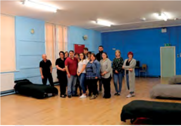
Gwirfoddolwyr yn helpu i ddarparu Lloches Nos Eglwysi Caerffili

Mae gan Gaerffili unedau llety â chymorth o ansawdd uchel a thrwy'r Strategaeth hon byddwn yn cymryd camau i sicrhau ein bod yn gallu cefnogi'r rhai ag anghenion mwy cymhleth, a darparu'r cymorth a'r llwybrau llety cywir. Ein blaenoriaeth yw hybu cymunedau a thenantiaethau cynaliadwy a'n prif ffocws yw sicrhau bod gennym y gwasanaeth cywir i gefnogi pobl er mwyn galluogi pobl i fyw'n annibynnol yn eu cartrefi neu pan na fydd hynny'n bosibl, mewn llety â chymorth sy'n 'gynhwysol i bawb' ac sy'n cyflawni eu hanghenion cymorth sylfaenol; a phan fydd pobl yn barod i symud ymlaen, byddant yn cael eu cefnogi i gyflawni hynny'n llwyddiannus.