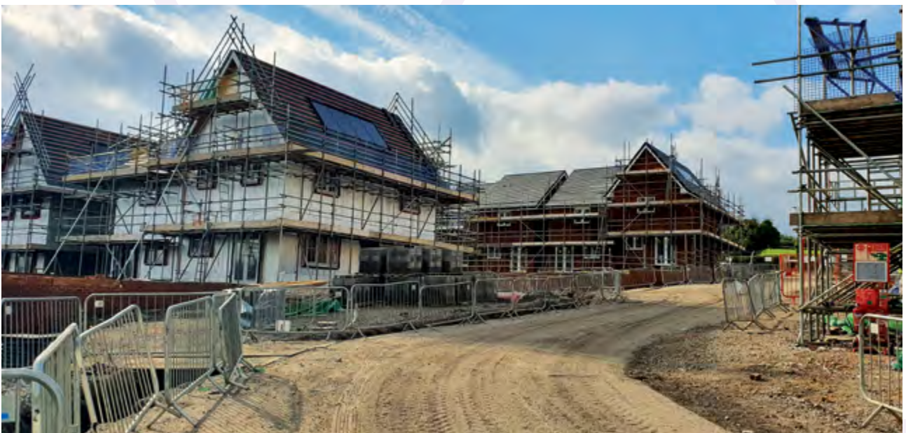
Gwaith adeiladu ar y gweill mewn datblygiad tai fforddiadwy ar hen safle Glofa Penallta (UWHA)

Rydym yn ymrwymedig i weithio gydag asiantaethau statudol a gwirfoddol eraill i gytuno ar fesurau effeithiol i atal ymddygiad gwrthgymdeithasol