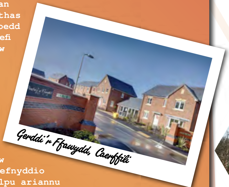
Gerddi'r Ffawydd, Caerffili

I gydnabod y dull arloesol hwn, enillodd y datblygiad wobwr Arloesedd Adeiladu Arbenigrwydd yng Nghymru am y dathliad mwyaf a disgleiriaf o arfer gorau (2019).