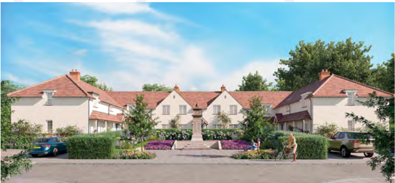
Argraff arlunydd o ddatblygiad deiliadaeth gymysg arfaethedig ym Mhentref Gerddi'r Siartwyr, Pontllan-fraith (Pobl)

Ochr yn ochr â landlordiaid cymdeithasol, byddwn yn hyrwyddo, cyfranogi, cefnogi ac yn cyfeirio trigolion drwy ein cyswllt o ddydd i ddydd gan gwmpasu model Gofalu am Gaerffili i 'fusnes fel arfer'. Byddwn yn nodi ein 'rhaglen gysylltu' gan nodi lle a sut y gallwn ymgysylltu â thrigolion a thenantiaid yn Gofalu am Gaerffili; gallai hyn ddigwydd pan fyddwn yn darparu cyngor a chymorth i denantiaid mewn dyled, pan fyddwn yn ymweld â thenant yn y sector rhentu preifat sydd wedi cwyno am ansawdd eu cartref neu pan fyddwn yn ymweld â pherchennog sydd angen addasiad i'w cartref. Byddwn yn gwneud i'n cysylltiad â thrigolion gyfrif.