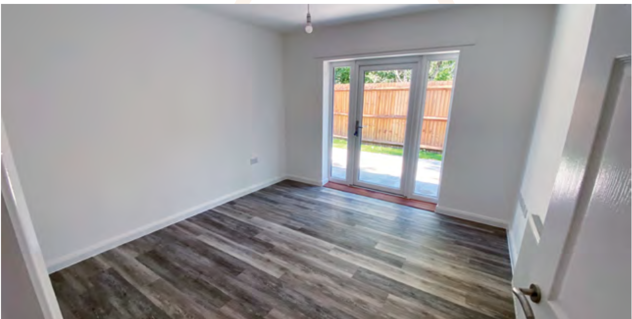
Golygfa fewnol o dai fforddiadwy yn Rhodfa Glan-yr-afon, Deri (UWHA)

Mae'r Cyngor wedi llwyddo i gael gafael ar gyllid i ddatgloi safleoedd strategol. Mae hyn yn aml yn canolbwyntio ar safleoedd mwy ac mae'r Cyngor yn awyddus i archwilio sut y gallai ddefnyddio