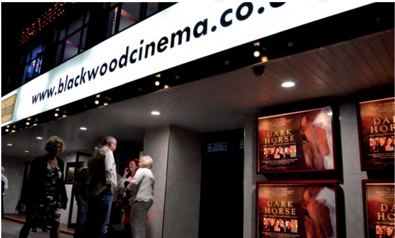
Sinema'r Coed Duon, sy'n darlunio economïau'r dydd, gyda'r nos ac yn ystod y nos