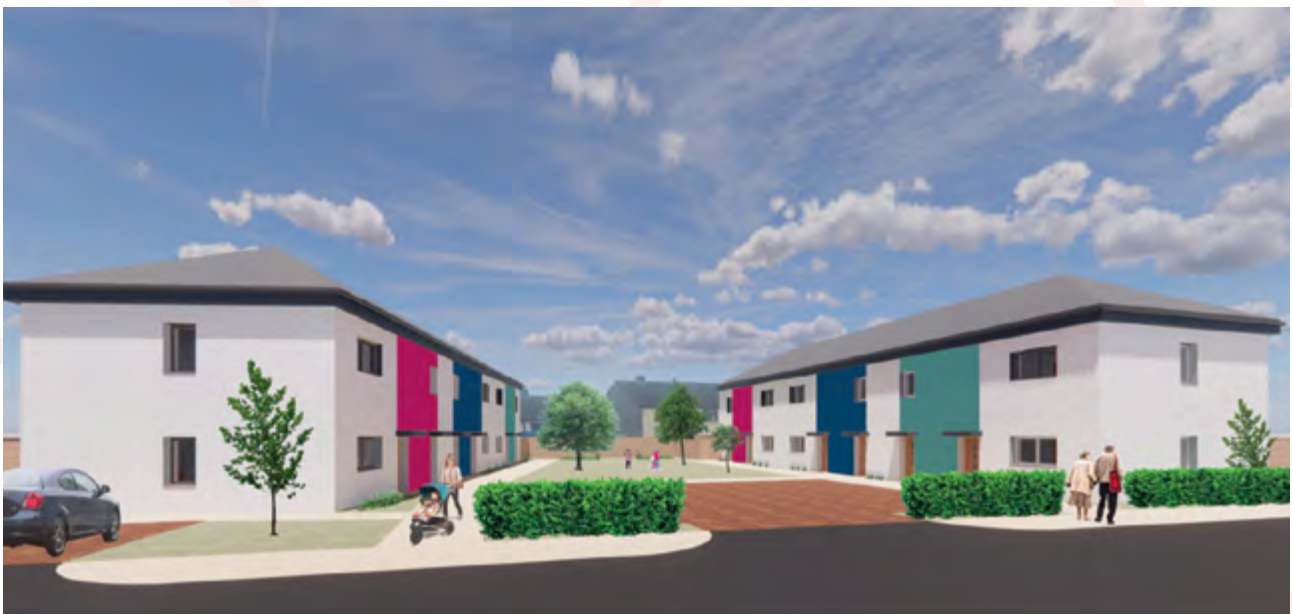
Argraff artist o ddatblygiad tai fforddiadwy newydd yn Trethomas (Cartrefi Caerffili)