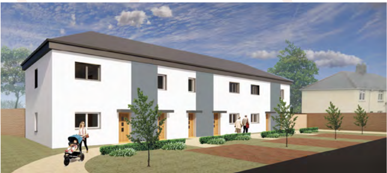
Argraff arlunydd o ddatblygiad Trecenydd

Bydd y Cyngor yn chwyldroi ei wasanaethau drwy dechnoleg a buddsoddiad technegol a fydd yn rhoi mwy o sylw ar y cwsmer. Byddwn yn defnyddio data a gwybodaeth am denantiaid i gefnogi dadansoddeg ragfynegol fel dull o nodi angen yn y dyfodol a theilwra gwasanaeth. Byddwn yn cyflwyno gwasanaethau mewn cymunedau drwy hybiau i gwsmeriaid a gweithio'n hyblyg a chreu mwy o gyfleoedd i denantiaid a lesddeiliaid ymgysylltu drwy gyfleoedd ar y rhyngwrwyd, i reoli eu cyfrifon ac archebu atgyweiriadau. Bydd cwsmeriaid yn gallu trefnu i nifer o ymholiadau gael sylw mewn un cysylltiad a bydd gan staff rheng flaen yr offer a'r wybodaeth sydd ei hangen arnynt i weithredu ar draws ffiniau adrannol.