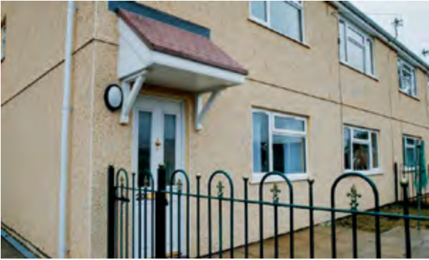
Cartrefi yn Lle Rowen, Rhydymni ar ôl gwelliannau allanol

gwasanaethau tai yn unig. Bydd y ffofws cychwynnol ar ddatblygu protocol symud ymlaen ar gyfer ail-gartrefu'r rhai mewn llety brys/dros dro i mewn i lety parhaol mwy addas. Byddwn yn datblygu Cynllun Pontio Ailgartrefu Cyflym yn nodi sut y bydd ein gwasanaeth yn symud tuag at ddull Ailgartrefu Cyflym. Byddwn yn: