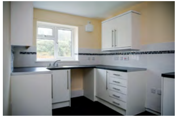
Cegin newydd o dan raglen Safon Ansawdd Tai Cymru (Cartrefi Caerffili)

atal cynnar a chyflawni anghenion pob un o'n trigolion a chefnogi'r bobl fwyaf agored i niwed. Mae un pwynt cyswllt ar gyfer symleiddio'r ymatebion drwy borth cyffredinol (drws ffrynt i wasanaethau drwy dîm cydlynu ac ymateb canolog) a gwasanaeth brysbennu (gwasanaeth diagnostig) yn ategu'r cynnig.