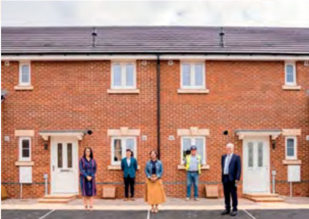
Tai fforddiadwy newydd yng Nghaeau Bedwellte, Aberbargod (Cartrefi Caerffili)

Cenedlaethol 4 , y fframwaith 20 mlynedd ar ddefnydd tir a bydd angen i'r 2il Gynllun Datblygu Lleol alinio ac ymateb i hyn.