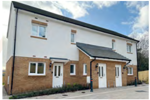
Datblygiad tai fforddiadwy newydd ym Mhen-yr-heol (UWHA)

Mae argymhellion 'Adroddiad yr Adolygiad Annibynnol o Dai Fforddiadwy' 6 yn llywio ein dull gweithredu, adroddiad a oedd yn darparu cyfleoedd newydd i gynyddu'r cyflenwad ac ansawdd tai fforddiadwy a galluogi awdurdodau lleol i adeiladu. Mae ein landlordiaid cymdeithasol partner yn cyflwyno cyfleoedd newydd i ddarparu tai fforddiadwy; mae eu huchelgeisiau ar gyfer twf wedi'u nodi yn eu strategaethau datblygu ac mae angen i ni weithio'n agosach i'w cynorthwyo i gyflawni eu