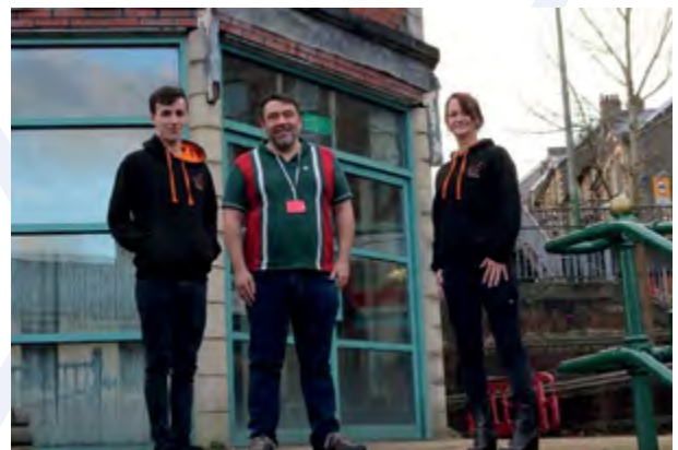
Staff cymorth yn y lloches nos, Crymlyn