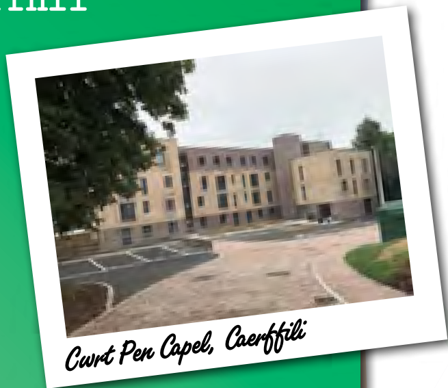
Cwrt Pen Capel, Caerffili

Nid yw'r cartrefi yn cynnwys system wresogi gonfensiynol ac mae costau ynni'n isel. Oherwydd hynny, mae'n helpu mynd i'r afael â thlodi tanwydd.