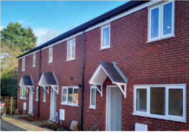
Tai fforddiadwy yng Ngerddi Sycamore, Oakdale (Pobl)

cael dealltwriaeth gywir o angen yn y dyfodol a'r ddarpariaeth bresennol.