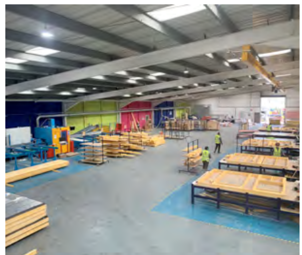
Celtic Offsite - ffatri ffrâm bren newydd, Caerffili (UWHA)

Mae'r Cyngor wedi dechrau ar raglen i nodi eiddo yr arferai'r Cyngor fod yn berchen arnynt, a werthwyd o dan y broses hawl i brynu a'u caffael gan ddefnyddio grant gan y llywodraeth, i ddechrau eu defnyddio fel tai cymdeithasol unwaith eto, a helpu'r Cyngor i gyflawni'r angen am dai.