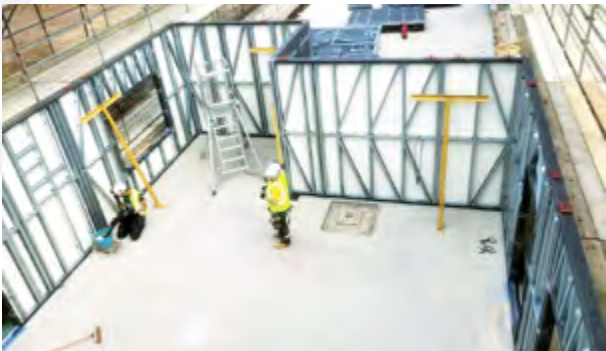
Adeiladu system ffrâm ddu arloesol yn Nhrecenydd (Cartrefi Caerffili)

Yn gynharach yn ein Strategaeth Tai Lleol fe wnaethom nodi ein hymrwymiad i fod yn garbon niwtral net erbyn 2030 ac mae'r Strategaeth Datgarboneiddio ar gyfer y Fwrdeistref Sirol yn nodi ein blaenoriaethau a'n cynlluniau. Mae hyn yn cyflwyno goblygiadau arwyddocaol ar gyfer y cartrefi presennol yng Nghaerffili.