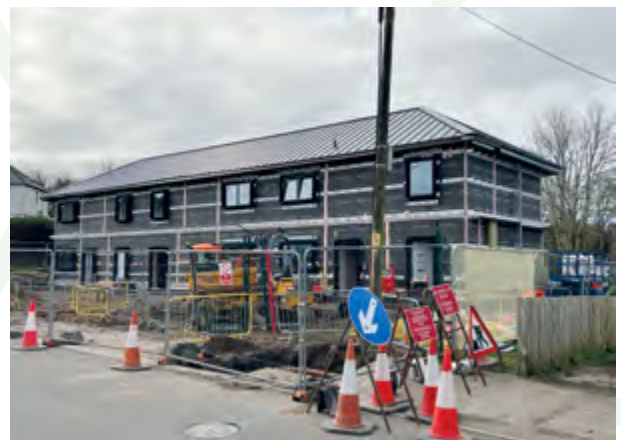
Datblygiad tai fforddiadwy yn Nhrecenydd (Cartrefi Caerffili)

Bydd y Cyngor yn sicrhau y bydd y seilwaith clyfar angenrheidiol yn cael ei gyflwyno mewn cartrefi er mwyn eu diogelu ar gyfer y dyfodol er mwyn iddynt allu manteisio'n llawn ar dechnolegau SMART wrth iddynt ddatblygu.