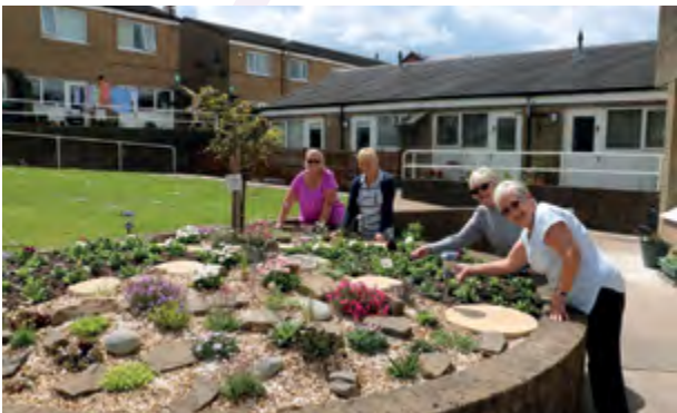
Preswylwyr ym Mhentwyn-mawr yn gofalu am yr ardd arobryn (Cartrefi Caerffili)

Mae mynd i'r afael â phenderfynyddion iechyd a llesiant gwael drwy wella amodau tai yn y sector preifat yn un o amcanion y Cynllun Corfforaethol. Bydd gwella ansawdd tai yn lleihau'r pwysau ar wasanaethau cyhoeddus eraill, ac iechyd a gofal