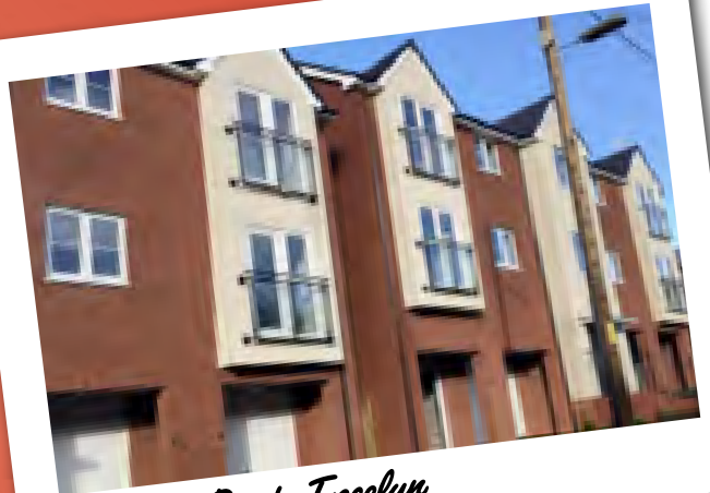
Ashfield Road, Trecelyn

Mae'r datblygiad yn Ashfield Road, Trecelyn, yn enghraifft dda o'r Cyngor yn cydweithio â chymdeithas dai partner i ddarparu llety byw'n annibynnol i bobl ag anabledd dysgu. Mae'n cynnwys 8 fflat ag un ystafell wely dros dri llawr ac wedi'u rhannu rhwng dau floc o fflatiau. Mae'r datblygiad wedi'i adeiladu gan Pobl Group gan ddefnyddio cyllid grant gan Lywodraeth Cymru ac mae wedi'i leoli ar safle hen swyddfa ddi-doli'r Post Brenhinol.