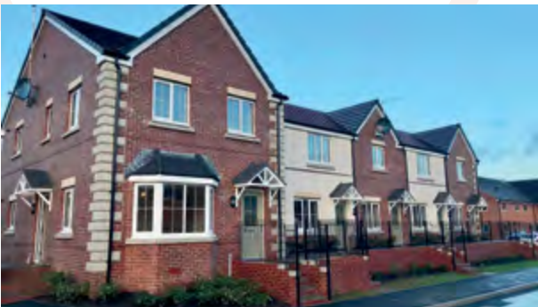
Tai fforddiadwy yn Glade Caerffili, Caerffili (UWHA)

Rydym yn awyddus i ddenu mwy o bobl i symud i ogledd y Fwrdeistref Sirol a byddwn yn ymchwilio i gynnyrch posibl a allai helpu i gyflawni hyn. Rydym yn awyddus i ddenu Prynwyr am y Tro Cyntaf, tenantiaid sydd eisiau prynu, aelwydydd sydd newydd gael eu creu, graddedigion sy'n dychwelyd i Gaerffili a gweithwyr allweddol. Gallai ddilyn model 'cartrefu' sy'n cynnig cartrefi am bris sy'n is na'u gwerth ar y farchnad ond sydd angen buddsoddiad a gallai hyn ffurfio rhan o'r strategaeth cartrefi gwag.