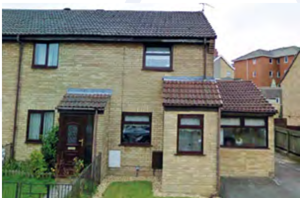
Enghraifft o eiddo prosiect Allweddi Caerffili

Byddwn yn archwilio ac yn cynyddu'r cyfleoedd y gall y Sector Rhentu Preifat eu cynnig i ddarparu atebion i bobl ag angen tai. Rydym yn bwriadu ymgynghori â landlordiaid i ddeall beth yw'r heriau a'r rhwystrau iddynt hwy wrth ddarparu llety i aelwydydd sy'n ddigartref neu sydd mewn perygl o fod yn ddigartref a byddwn yn datblygu opsiynau sy'n cymhell landlordiaid i weithio gyda'r Cyngor er mwyn i ni allu arfer ein dyletswydd yn effeithiol i'r sector Rhentu Preifat. Gallai hyn gynnwys yr awdurdod lleol yn gweithredu fel