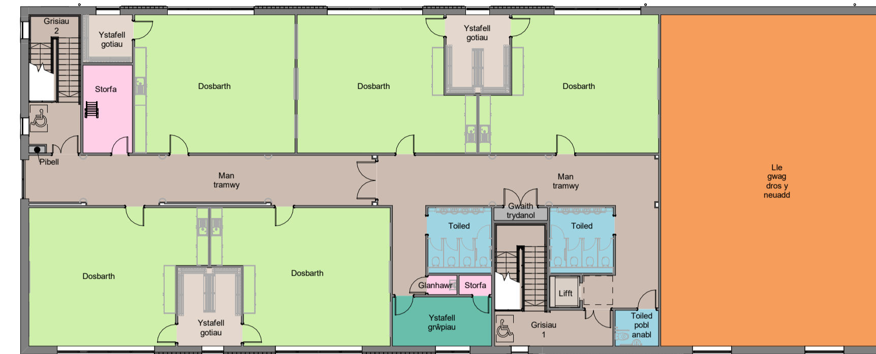
Llawr Cyntaf 1 : 200