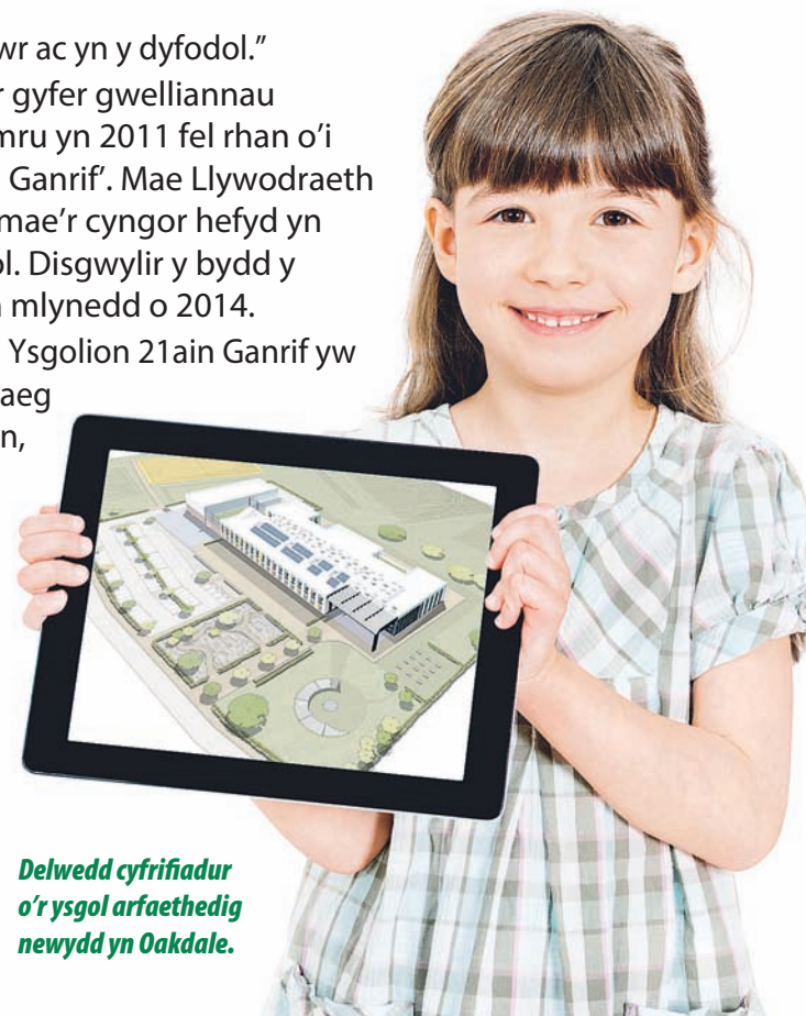
Delwedd cyfrifiadur o'r ysgol arfaethedig newydd yn Oakdale.

01443 864355 ; e-bost: powelsm@caerffili.gov.uk