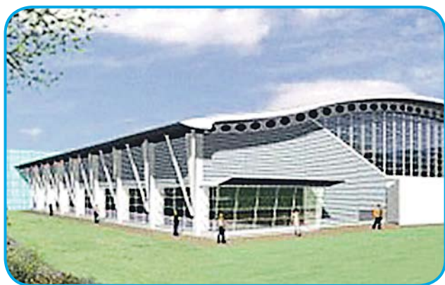
■ Canolfan Hamdden Newydd

Mae gweithfeydd nawr yn cael ei hymgymryd ar y datblygiad cyffrous newydd hwn a fydd yn arwain at greu Llyfrgell a Chanolfan Gwasanaethau newydd, lle gall drigolion gael mynediad