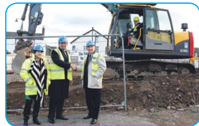
■ Gweithfeydd Llyfrgell ar Fynd

"Edrych ymlaen at weld y cynlluniau hyn yn parhau i gynyddu dros y misoedd i ddod," ychwanegodd.